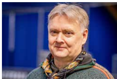
Ny generalsekretær s. 12