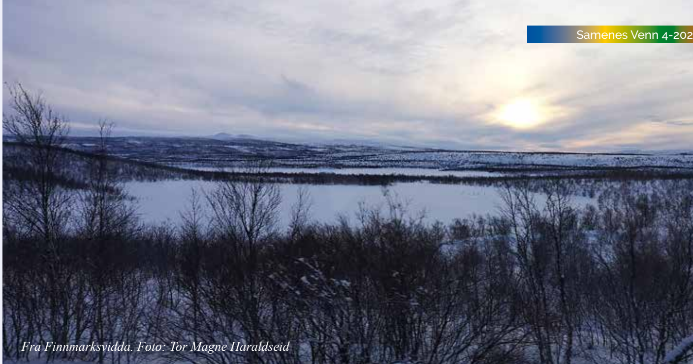
Fra Finnmarksvidda.

eller gjøre en slik dag. Vi drikker kaffe i stuene. Akko stikker til oss en reinost og et par reintunger. Vi stiller mat selv, men både Ellen og Mikkel sier at i dag skal vi være deres gjester.