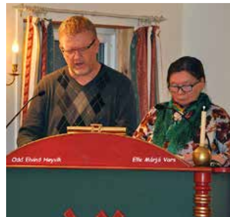
Fra høststevnet i Kautokeino i 2020.

– Jeg skulle aldri ha sagt meg villig til å være det, jeg passet ikke til det. Jeg anser det som en mindre vellykket del av tjenesten min i Samemisjon. Jeg ble bedt om å overta som styreformann, i en krevende situasjon. Det var ikke lett å finne kandidater, og jeg ønsket å avhjelpe organisasjo-