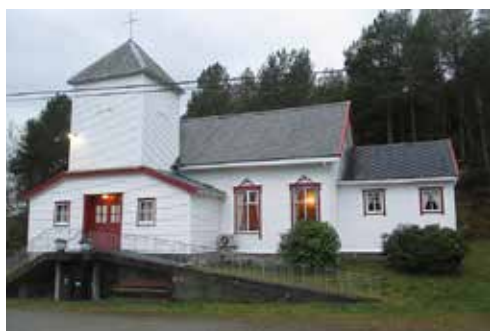
Misjonsglimt Møre og Romsdal s. 11