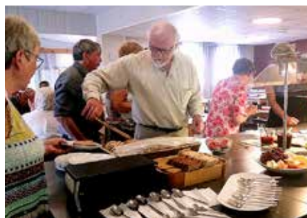
Hver enkelt gjest ble servert av betjeningen på Mjuklia Gjestegård.