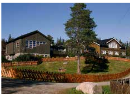
Mjuklia Leirsted og Gjestegård.