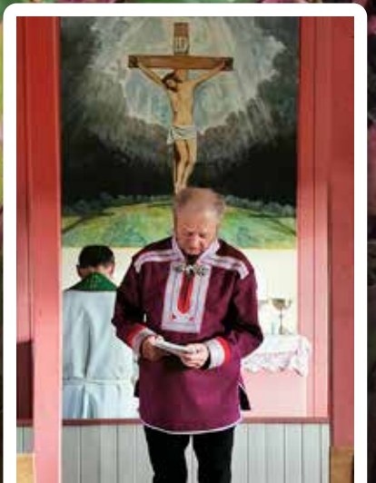
Sommer- gudstjenestene s. 16