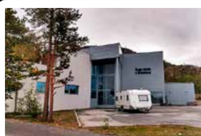
Landsmøteprogram s. 9–11

Organ for Norges Samemisjon nr. 3, 2020 – Årgang 95