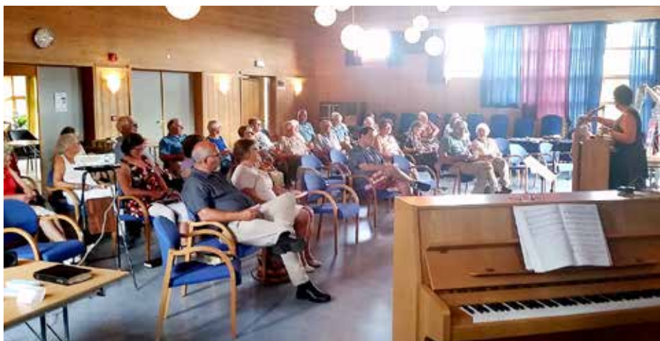
Fra misjonslotteriet der gevinstene bringes de heldige vinnerne av et barn som møtte opp på festen.